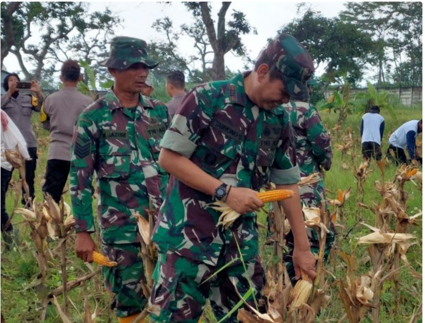
Wujudkan Ketahanan Pangan Bersama TNI AD, Lapas Terbuka Kendal Panen Jagung Bersama

KENDAL – Sinergi dengan TNI AD dalam hal ini Koramil 02/Patebon, Lapas Terbuka Kendal wujudkan program ketahanan pangan dengan melaksanakan